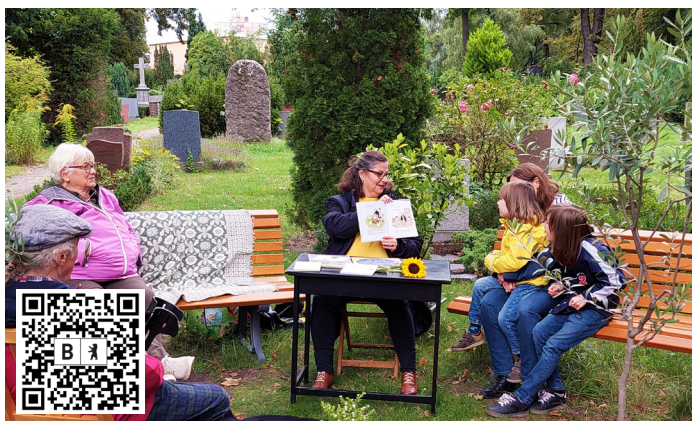
Lesung beim Tag des Friedhofs 2021