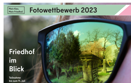
Plakat vom Fotowettbewerb 2023