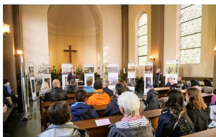
Ausstellung Tag des Friedhofs 2022