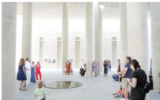
Krematorium Friedhof Baumschulenweg Tag des Friedhofs 2023