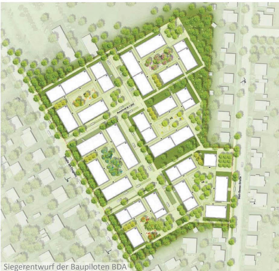
Siegerentwurf der Baupiloten BDA