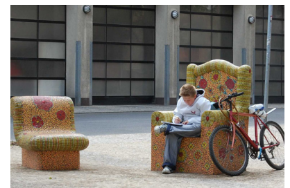
Platzgestaltung Emser Straße / Vorplatz Albrecht- Dürer- Oberschule Ein Ort im Quartier - Drei Plätze im Dialog